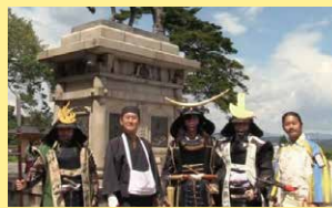
奥州仙台おもてなし集団伊達武将隊がスタンプラリーを応援。