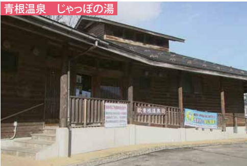
気軽に入れることで人気の共同浴場