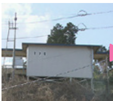
旧歌津駅のホーム 津波は駅の高さを超えて、裏の住宅団地を壊滅させました。