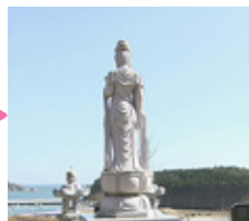
鎮魂の森 この地区で、犠牲になられた42名の鎮魂と祈りの場所です。