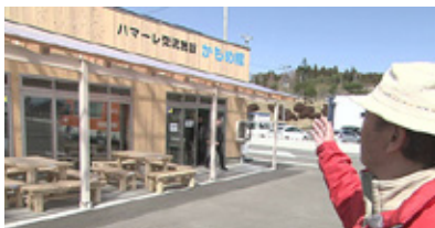
ハマレ交流施設かもめ館