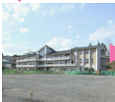
建て替えられた中学校 震災時、住民は中学校のある高台に避難しました。