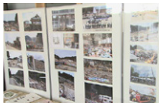
かもめ館に展示されている被災写真