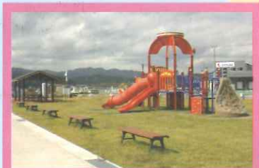
荒島・楽天パーク