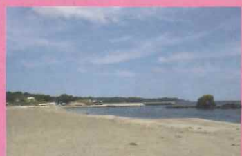
サンオーレそではま