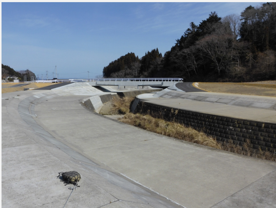
左岸堤より下流を望む。