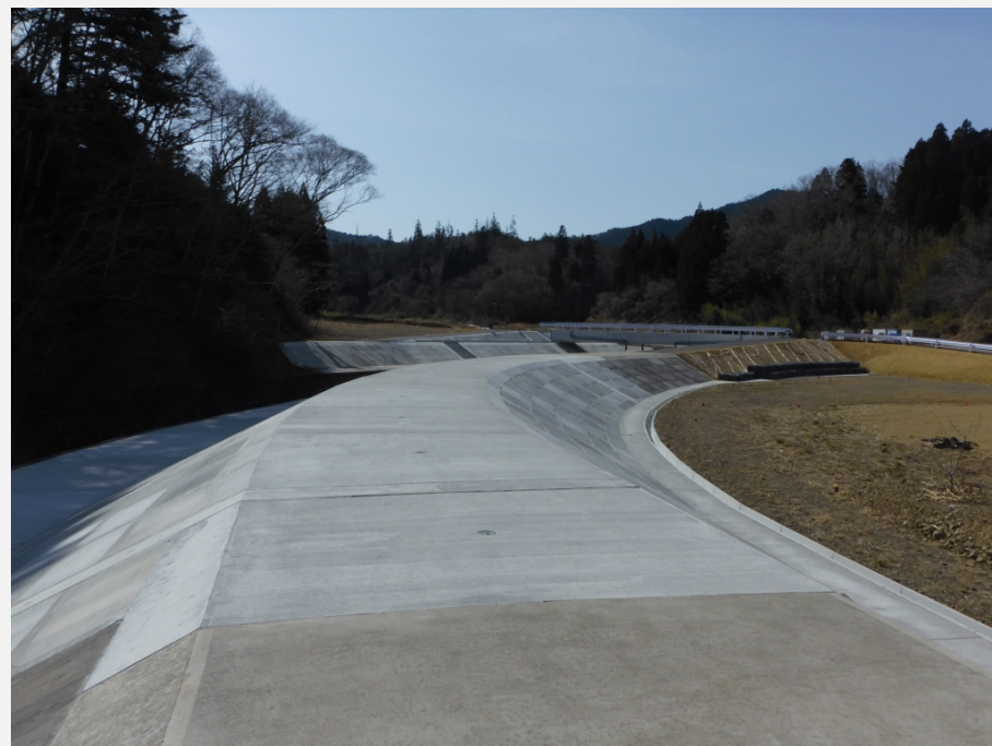
左岸堤より上流を望む。