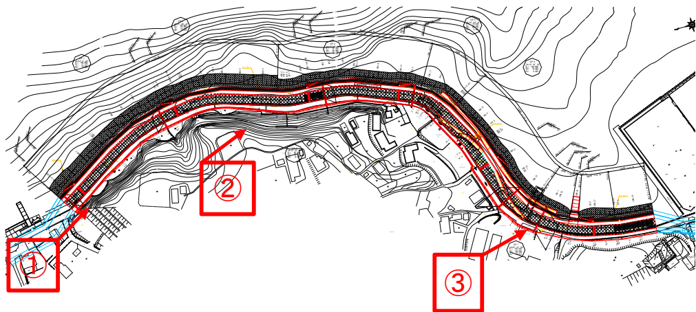
① 着手前 平成26年4月