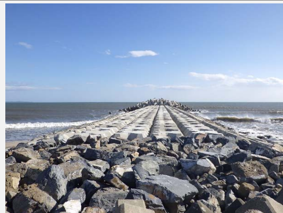
5号突堤の工事が完成