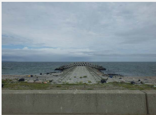
4号突堤の工事が完成