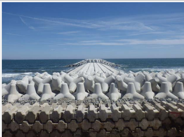
6号突堤の工事が完成