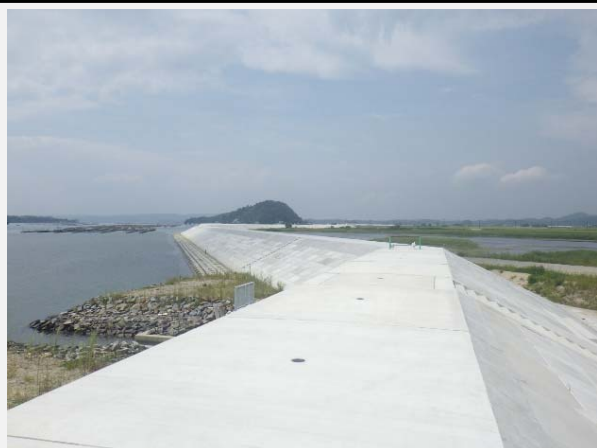
東名海岸堤防工事完成しました。