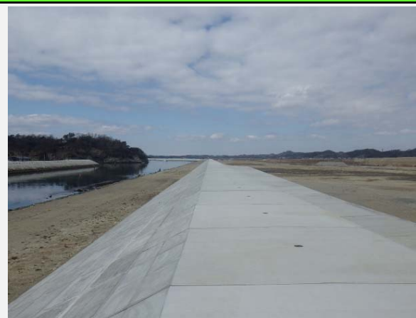
東名海岸堤防工事完成しました。