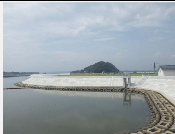
東名海岸堤防工事完成しました。