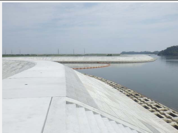
東名海岸堤防工事完成しました。