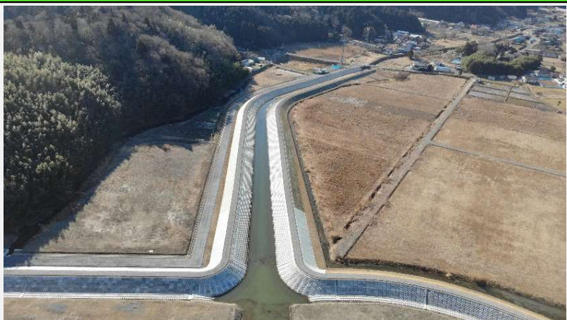
3・4・5工区状況(護岸ブロック敷設完了)