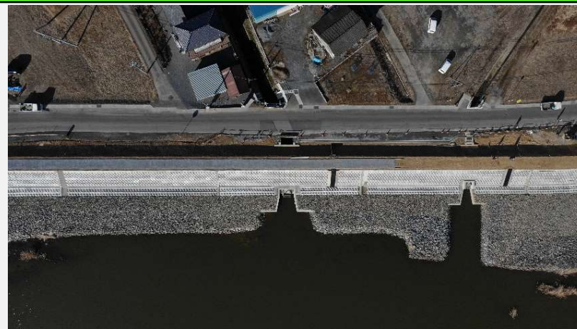
6工区⑤樋管施工状況(完了)