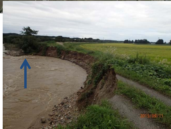
応急復旧断面(大型土のう設置+中詰土)