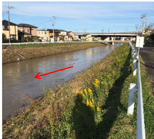
増田川(上増田水位観測所)