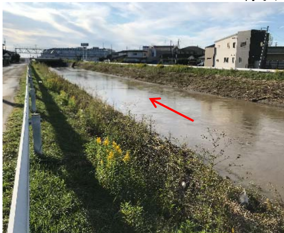
増田川(上増田水位観測所)