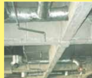
石綿含有耐火被覆材 (鉄骨の梁などの耐火被覆材)