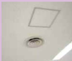
石綿含有ロックウール吸音天井板