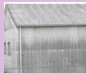
石綿含有スレート波板