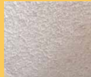
石綿含有パーミキュライト吹付け (天井断熱材・吸音材・結露防止用)