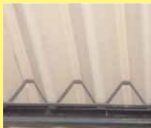
石綿含有断熱材 (屋根用折板断熱材)