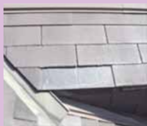
石綿含有住宅屋根用化粧用スレート