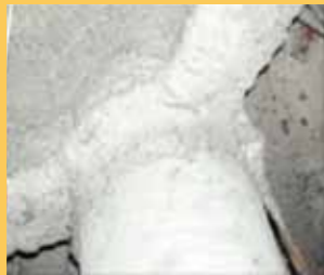
吹付け石綿 (鉄骨耐火被覆材)