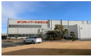
株式会社ニチレイフーズ 白石工場