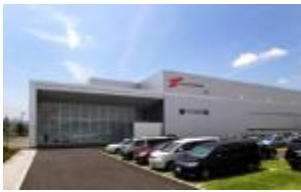
トーカドエナジー 株式会社 白石工場