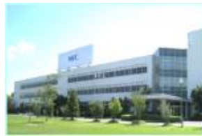
NECプラットフォームズ 株式会社 白石事業所