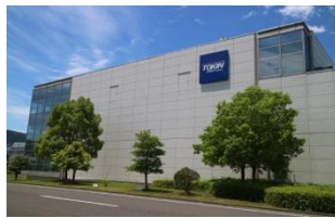
株式会社トーキン 本社/白石事業所