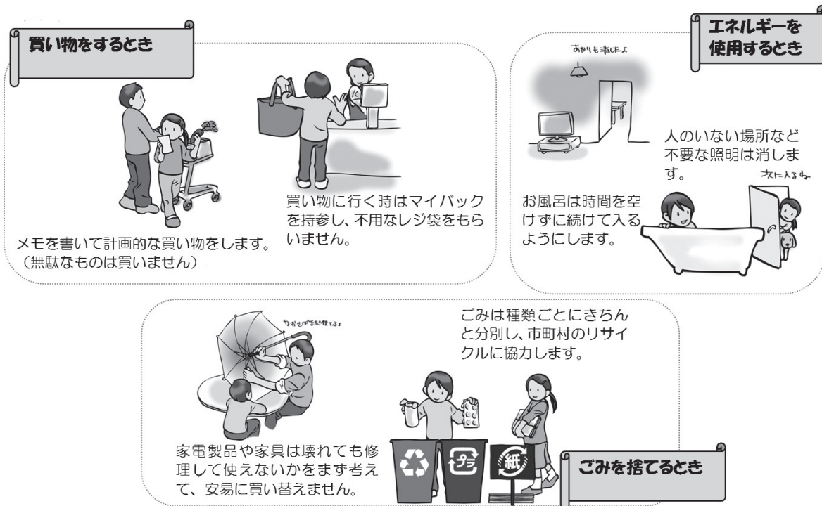
▲個人のできる環境配慮行動の一例（みどりの小道環境日記2013宮城版より抜粋）

（※みやぎe行動（eco do!）宣言については、第3部第5章第3節の記述も御参考ください。）