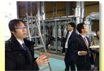
エコタウン推進委員会WG視察会(オガール紫波)