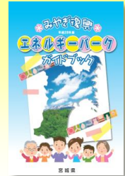
みやぎ復興エネルギーパークガイドブック

県内のエコタウン形成にかかる優れた取組を県内外に普及させるための印刷物「みやぎ復興エネルギーパークガイドブック」を作成 【事業費】621千円 【実施主体】県 【事業量】広報資料作成一式