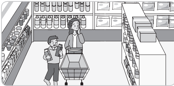
スーパーマーケット・デパート