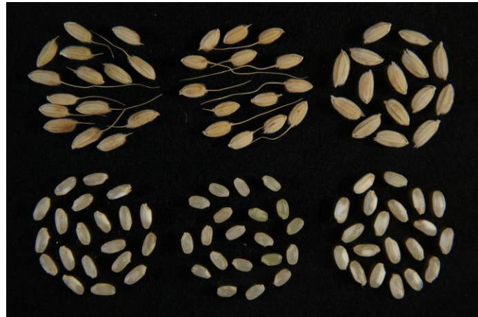
第2付図 玄米及びひ粃