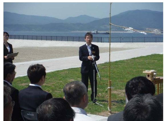
祝辞 気仙沼地方振興事務所長