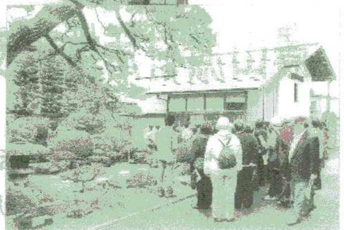
農家蔵・農家庭園ウォッチング