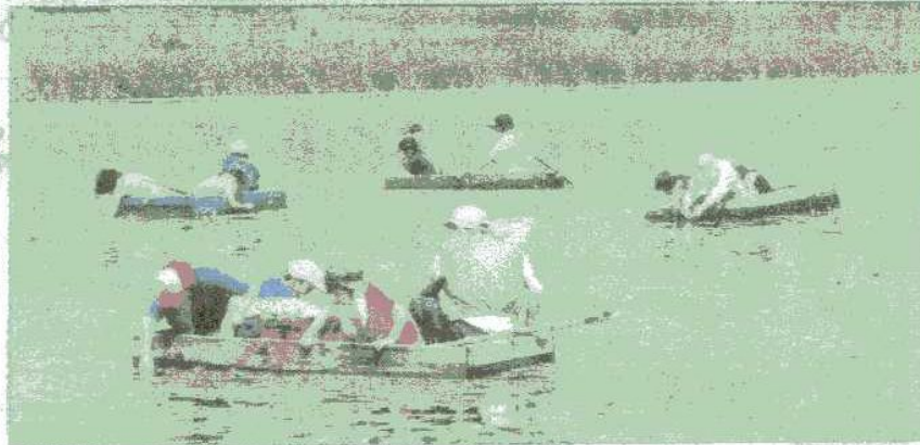
じゅんさい沼(じゅんさい摘み体験)