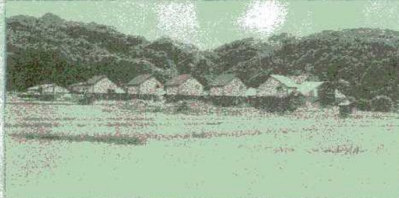
不動尊クラインガルテン