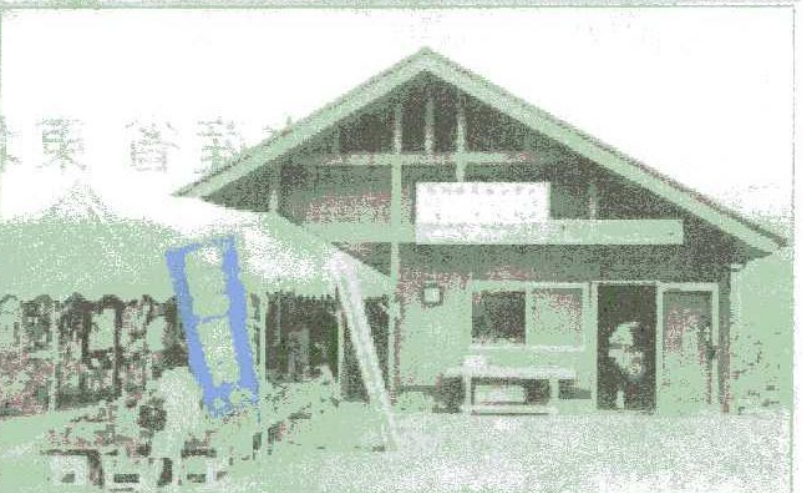
不動尊クラインガルテン直売所