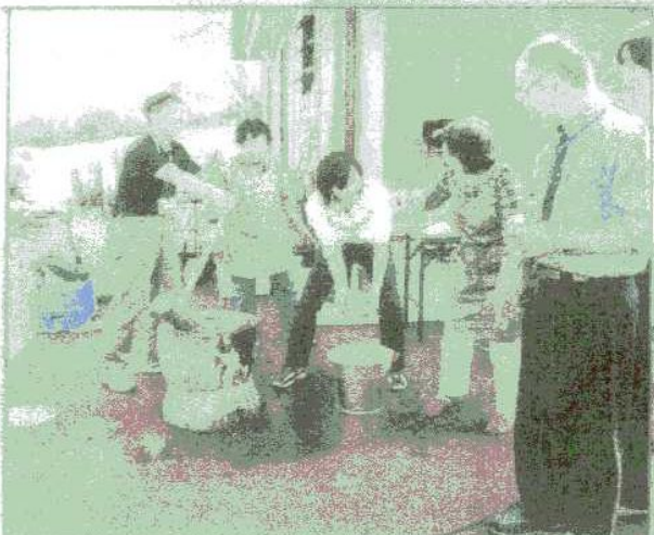
筆甫（ひっぽ）クラインガルテン・交流イベント