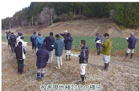
ねぎ現地検討会の様子