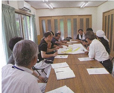
西戸川担い手懇談会