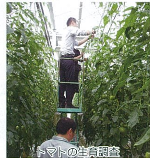
トマトの生育調査