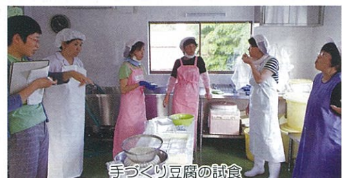
手づくり豆腐の試食