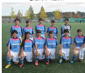
“ミヤイチのなでしこ” サッカー部