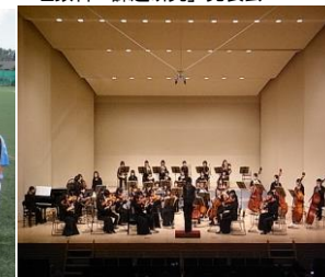
公立校唯一の管弦楽部