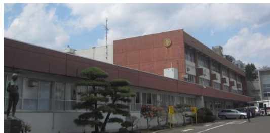
歴史と伝統ある校舎