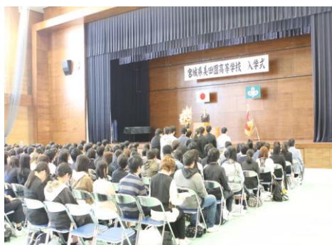
前期入学式（平成29年4月16日）