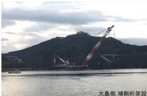
大島側 補剛桁架設