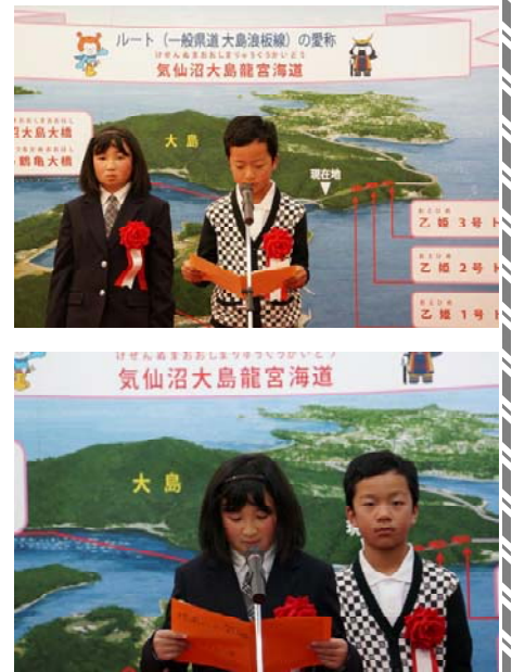
「大島架橋への想い」発表