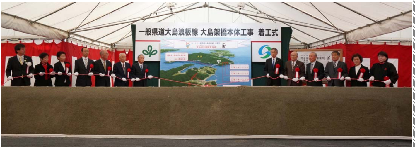
大島架橋事業施設名称選定委員会のみなさまによる名称披露

※名称選考の経緯等は、気仙沼土木事務所のホームページ http://www.pref.miyagi.jp/soshiki/ks-doboku/o-digest.html をご覧下さい。