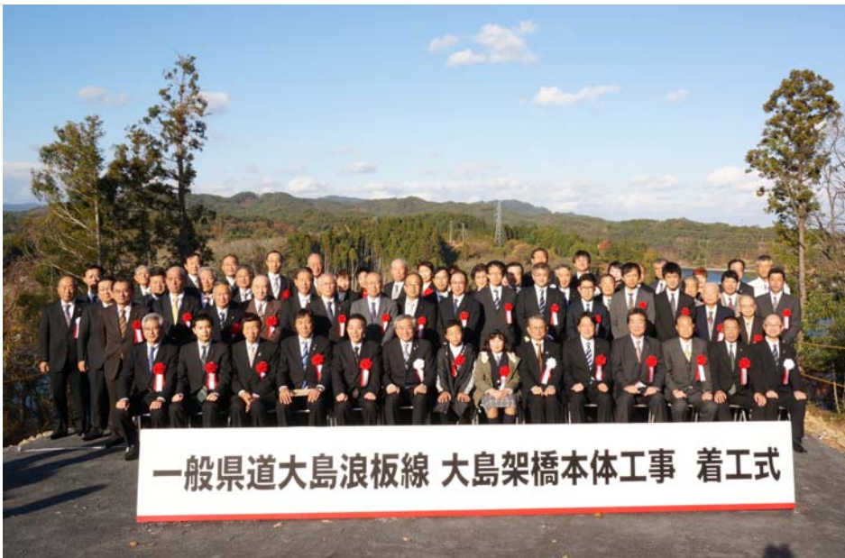
大島架橋位置で記念撮影

日時：平成26年11月15日（土） 午後1時から 場所：気仙沼市磯草地内（大島側架橋位置）