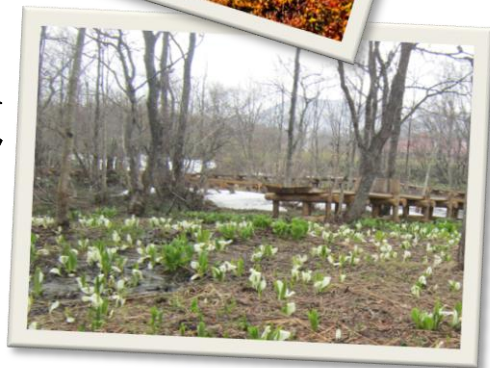
4月 耕英十字路付 近ミズバショウ