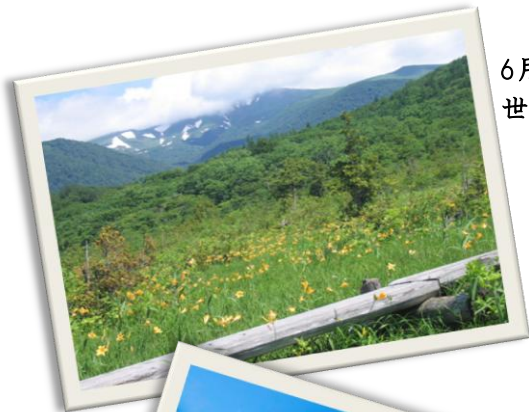
6月下旬 世界谷地原生花園