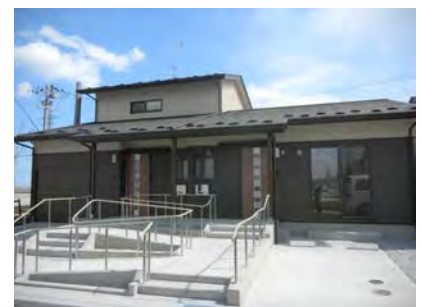
山元町に建設された災害公営住宅

建設地区や計画戸数、整備スケジュールなどの最新情報については、下記のホームページにて公表しておりますので、ご覧ください。