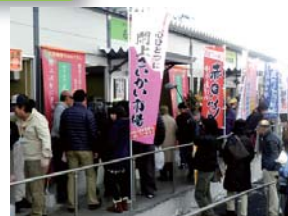
「閉上さいかい市場」