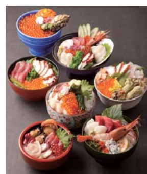
「南三陸 復活・キラキラ丼!」