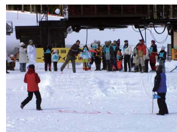
「スコップ雪投げ選手権」

■オニコウベスキー場 TEL:0229-86-2111 http://www.onikoube.com/