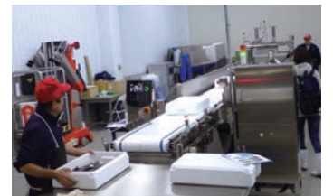
連続個別非破壊式放射能検出器