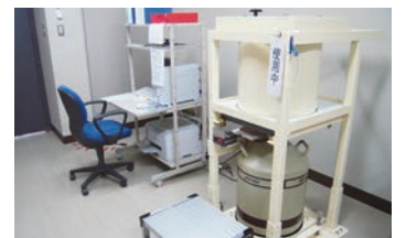
ゲルマニウム半導体検出器

検査結果は宮城県のホームページなどでお知らせしています 放射能情報サイトみやぎ ( http://www.r-info-miyagi.jp/r-info/ )