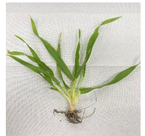
↑ 仙台の生育調査ほ場 ホワイトファイバー