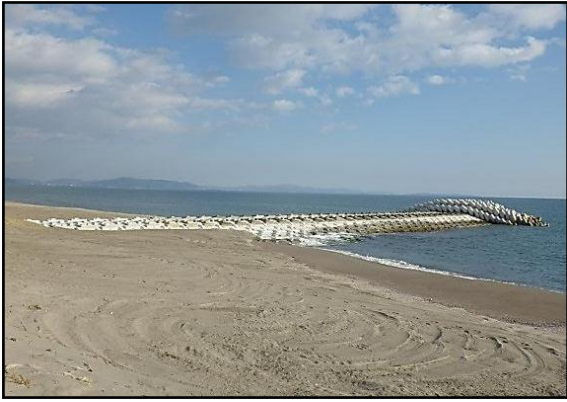
【大曲海岸の突堤工 完成状況】