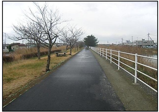
【北北上運河の築堤盛土 完成状況】