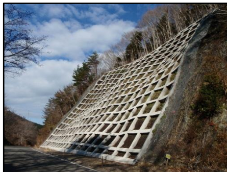
【(一)牡鹿半島公園線 石巻市新山浜地内】