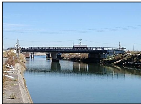
【(主)奥松島松島公園線 新不動橋】