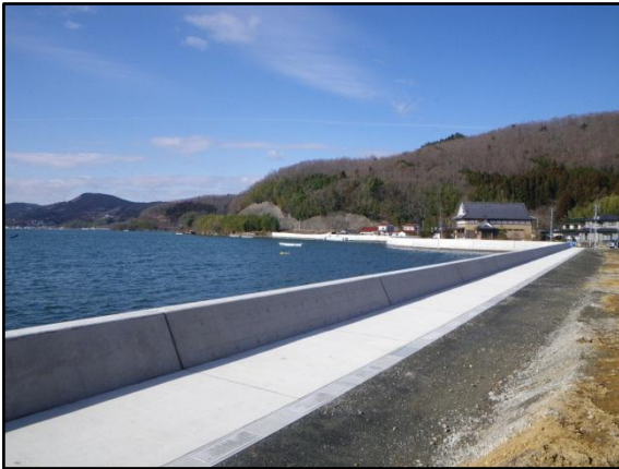
【安住海岸の護岸工 完成状況】