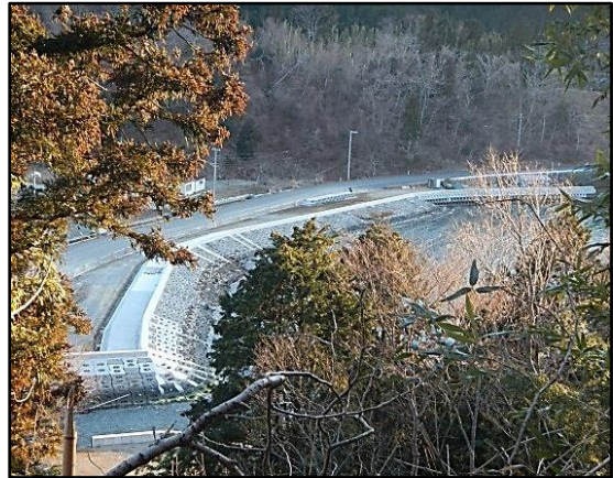
【猪落海岸の護岸工 施工状況】