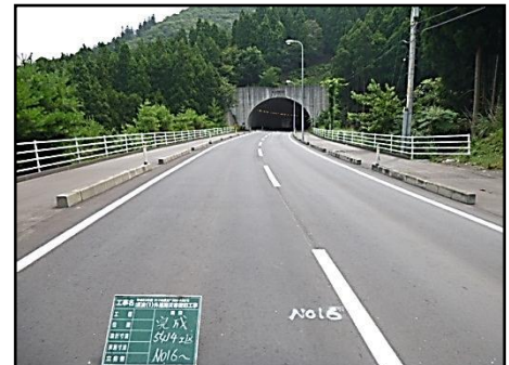
【(主)石巻鮎川線 石巻市渡波地内】