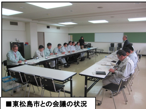
■東松島市との会議の状況