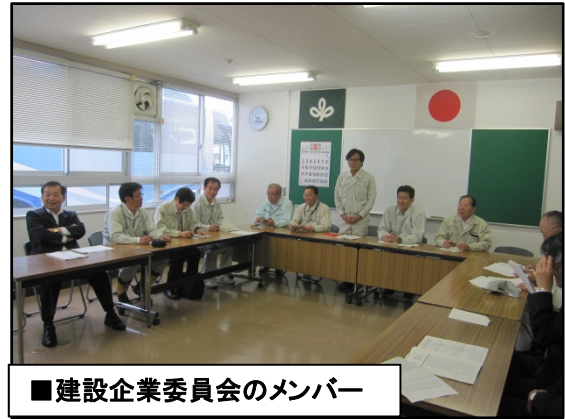
■建設企業委員会のメンバー

石巻市内では、内海橋災害復旧事業、(都)門脇流留線高盛土道路事業を、東松島市では、定川災害復旧事業、矢本海浜緑地、州崎海岸災害復旧事業、(主)奥松島松島公園線州崎復興道路事業、東名海岸災害復旧事業、東名運河災害復旧事業を視察しました。