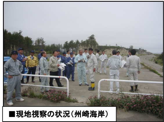
■現地視察の状況(州崎海岸)