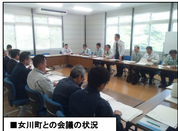
■女川町との会議の状況