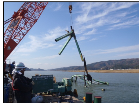
【津波で流出した(国)398号 新北上大橋の撤去が完了】