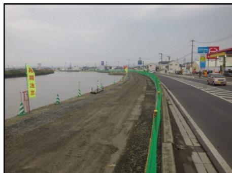
【定川の(国)45号並行区間 の仮設道路の状況】