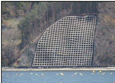
【(一)釜谷大須雄勝線 石巻市雄勝町明神地内】