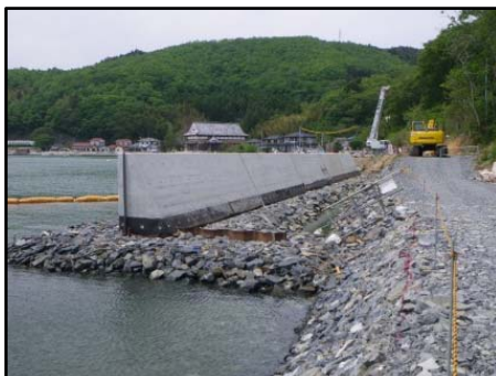
【安住海岸の護岸構築の状況】