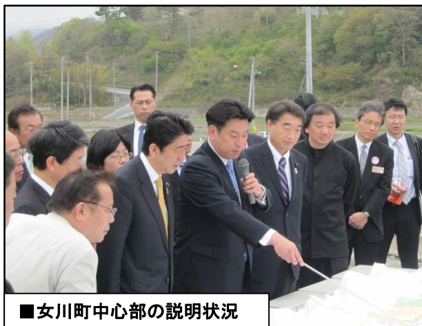
■女川町中心部の説明状況

各視察現場では、全国からの力添えをいただきながら造成工事が進められており、首相からは「復興が見えることで明日が見えてくる」「元の生活に戻れることが具体的に becoming」との言葉があり、住民に対しても復興が目に見えて進んでいる状況を確認しました。