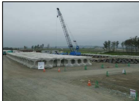
【大曲海岸のブロック製作状況】