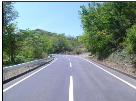
【(一)牡鹿半島公園線 女川町鷺神浜地内】