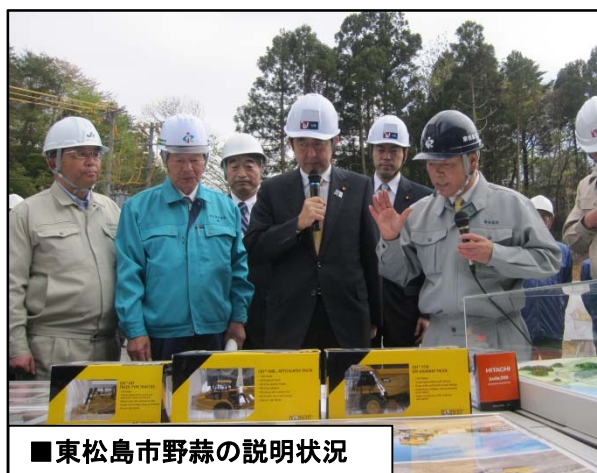
■東松島市野蒜の説明状況