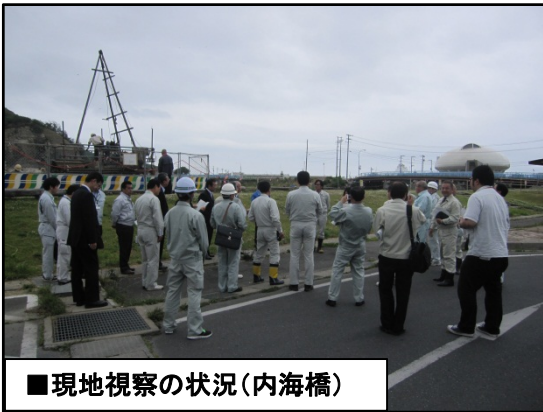
■現地視察の状況(内海橋)