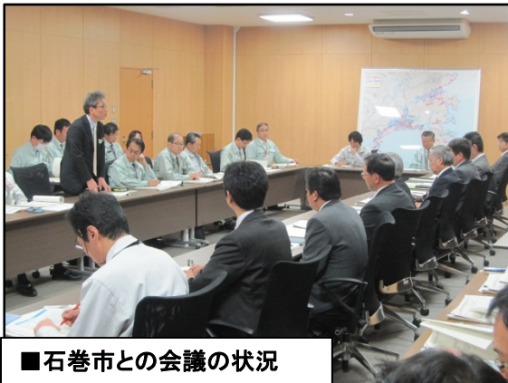
■石巻市との会議の状況

復旧・復興事業を推進するための情報共有と事業調整を行うため、管内市町と災害復旧・復興連絡調整会議を開催しました。