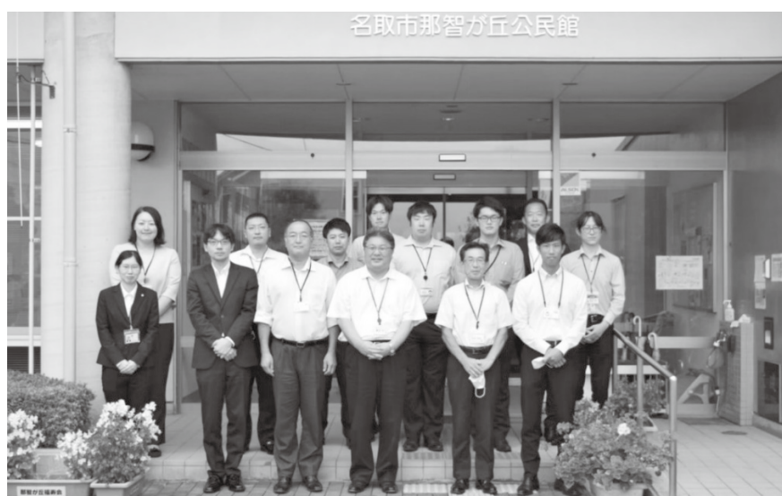
那智が丘公民館にて