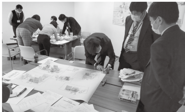
▲各市町の発表からキーワードを付箋に書き込み、グループ内で整理