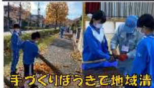
手づくりぼうきで地域清

〒989-1622 宮城県柴田郡柴田町西船迫4-1-2 生徒数 203名 TEL 0224-54-1225 FAX 0224-54-1226 P会員数 186名