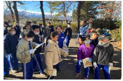
史跡案内支援（川崎要害地）