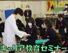
キャリア教育セミナー

校地内のラベンダーで作ったラベンダースティックやポップリを公共施設へ配布する。地域人材を活用した地域貢献活動。