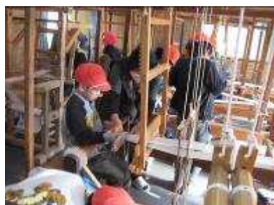
【ふるさと学習（地織体験 / 干し柿作り）】