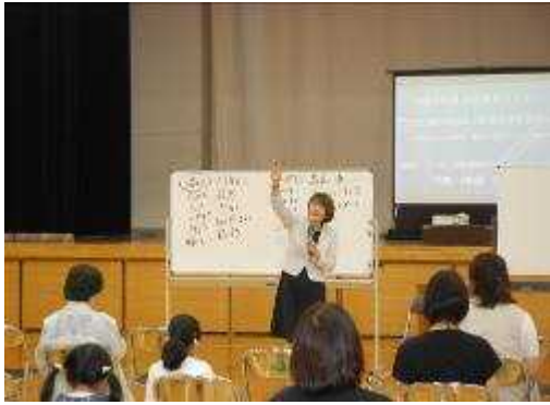
【 家庭教育セミナー 】