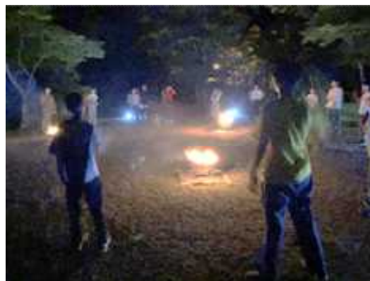
【ジュニア・リーダー活動（初級研修会 / 山の子キャンプ）】