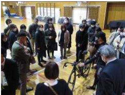
【 家庭教育支援講演会 （ 丸森小 / 館矢間小 ）】