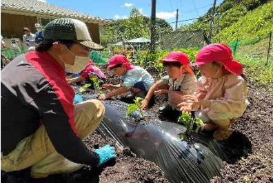
農業体験学習支援