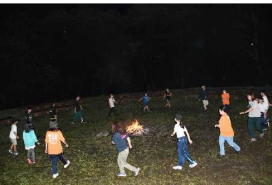
セカンドスクール支援