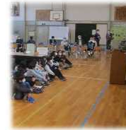
丸森未来防災フェスタ2022