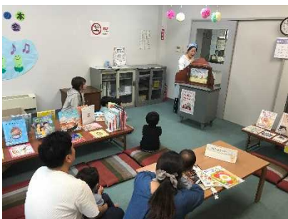
子育てサポーター活動