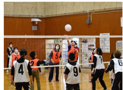
親子バレーボール大会