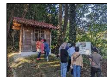
【各種講座及び学習機会提供事業】