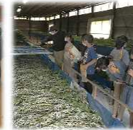
大張地区で蚕の学習