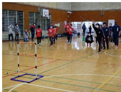
スポーツ少年団交流会