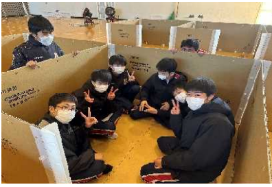
防災教育（避難所運営体験）