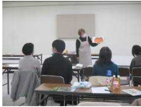
【 読み聞かせボランティア講座 】