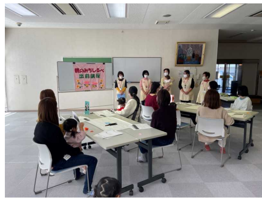
【親のみちしるべ出前講座】