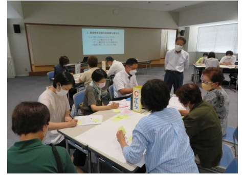
【しばたっ子応援団研修会】