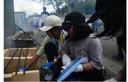
小学生わくわくデイキャンプ