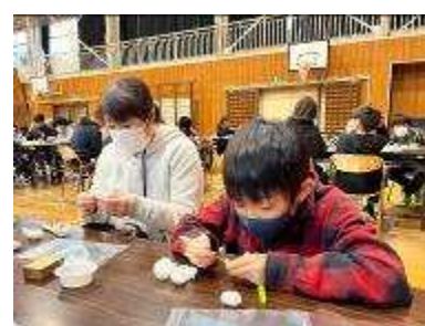
【出前講座（まゆ細工）】