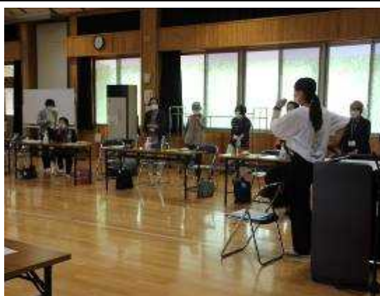
【 出前講座（ ニュースポーツ / 健康講座 ）】