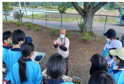
地域学習活動支援（土器拾い）