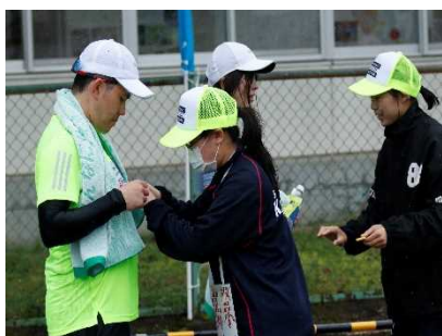
マラソン大会ボランティア