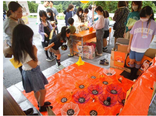
【子どもフェスティバル】