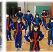
館矢間地区で松掛神楽の伝承