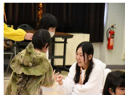
J・Lハロウィンパーティー