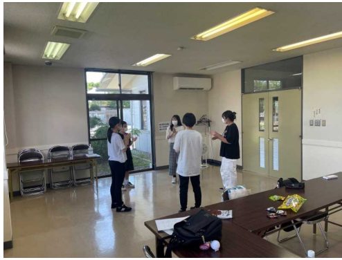
【ジュニア・リーダー定例会】