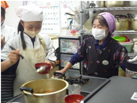
【しばたっ子応援団の派遣】