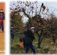
耕野地区で柿の収穫