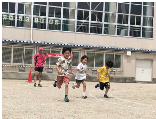
【男性向け家庭教育講座】