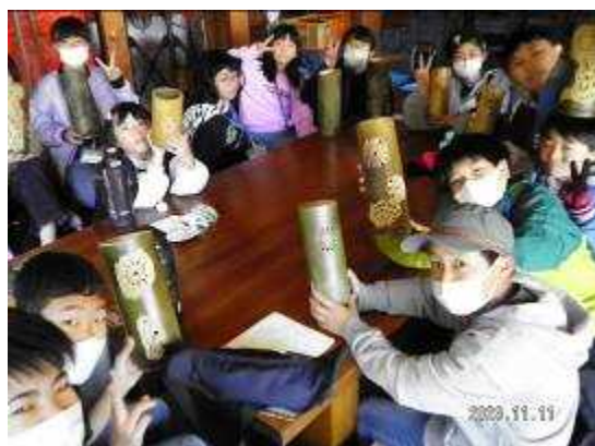
【土曜学び塾（竹あかり制作）】