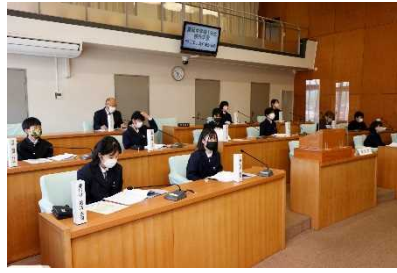
施設見学（議会体験）