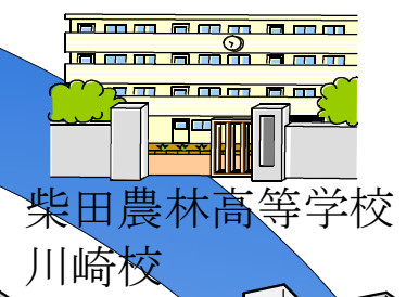
柴田農林高等学校 川崎校