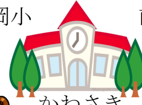
かわさき こども園