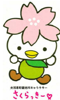
大河原町観光キャラクター さくら、きー♡