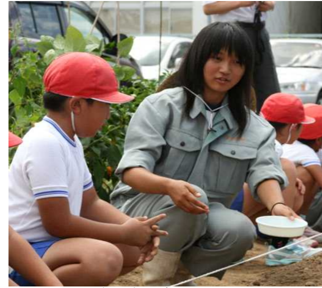
小・高交流：ダイコンの種まき

「体験活動等とおしながら、人とかかわり、社会の中で、自分の役割を積極的にはたし、より良く生きる児童生徒の育成」