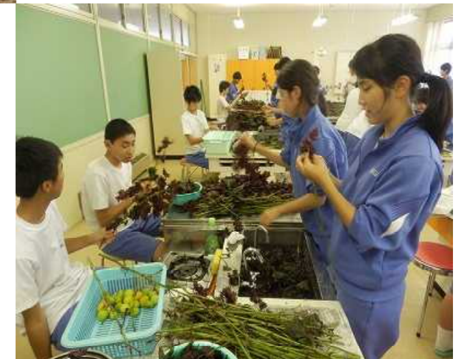
中・地域交流：梅干しづくり