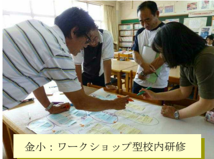
金小：ワークショップ型校内研修