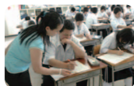
【毎日の授業】 学習と将来の職業とのかかわりを理解し、進んで学習に取り組む。