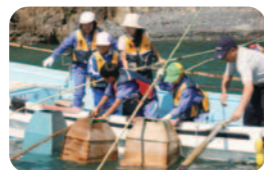
【農林漁業体験】 体験活動を通して職業について考え、よりよい生き方を求める。