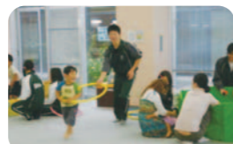
【インターンシップ】 実際の職場の中に入り、自己の適性を生かす進路を考える。