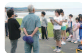
【地域の方との交流】 進んであいさつをし、地域の方々とかかわる。