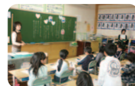
【道徳の時間】 自己の役割や責任について考える。