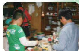
【家庭での手伝い】 家庭や身近な集団で自己の役割を果たす。