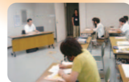
【キャリアセミナー】 仕事の内容を理解し、社会で果たす役割について考える。