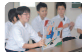
【学び合い】 人と人のつながりの大切さを理解し、学び合う。