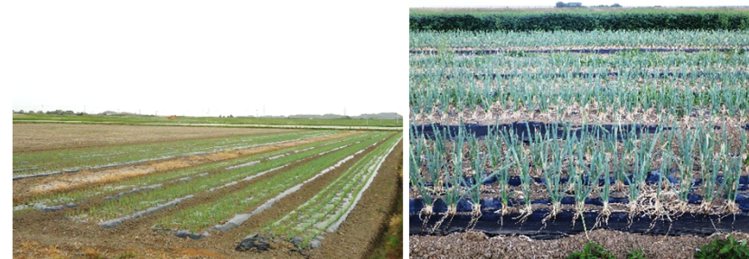
青ねぎ栽培の様子