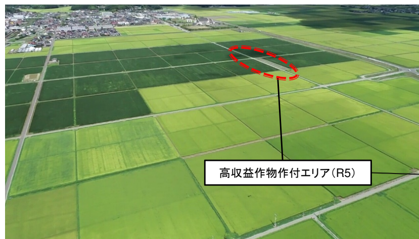
高収益作物作付エリア(R5)