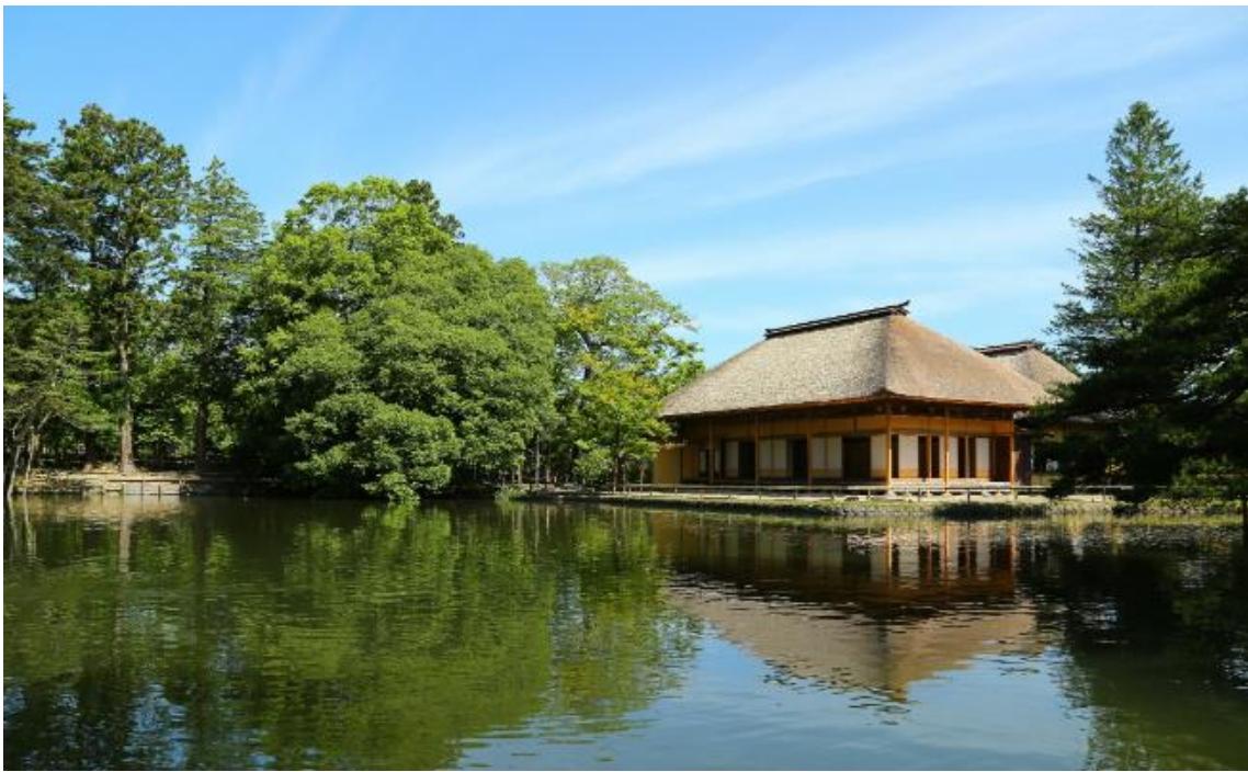
「大崎市 旧有備館」