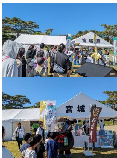
じゃんけん大会の様子

当日はむすび丸と牛政宗くんが登場し、じゃんけん大会も行われ、お子様連れの御家族などたくさんの方に御参加いただき、大いに盛り上がりました。