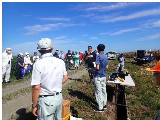
栽培概要説明の様子

普及センターでは、今後も主食用米から新たな転換作物の導入に向けた検討を支援していきます。