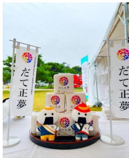
じゃんけん大会賞品のみやぎ米