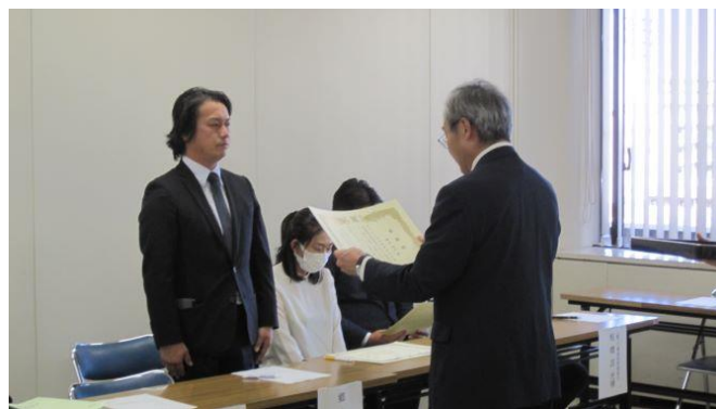
受け入れ農業者への感謝状贈呈