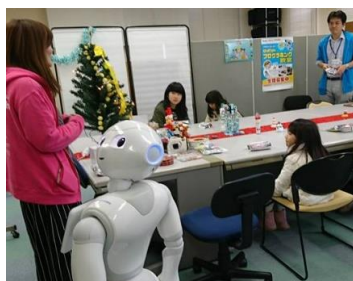
(プログラミング教室)