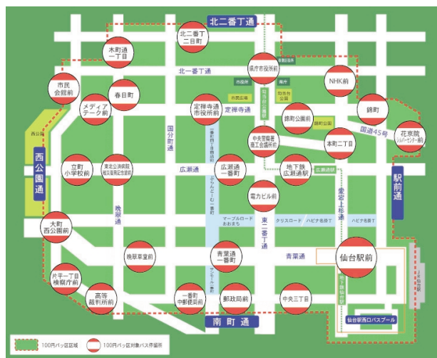
図 100円パッ区対象区域