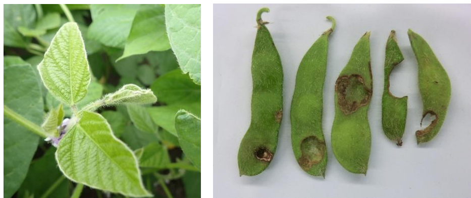
図 3. タバコガ類によるダイズの被害葉（左）と被害莢（右）

注) 若中齢幼虫の種の判別を行うのは困難であるため、番外から採集した若中齢幼虫を終齢幼虫または成虫まで飼育した後、吉松（2001）に従って同定した。