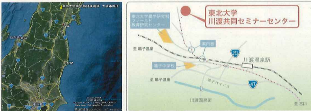
図1, 東北大学大学院農学研究科附属複合生態フィールド教育研究センター施設所在地 (左、縮小; 右、拡大)

東北大学大学院農学研究科附属複合生態フィールド教育研究センター隔離ほ場(通称, 隔離ほ場)および隔離ほ場内施設 (北緯38°44', 東経140°45', 標高140 m)