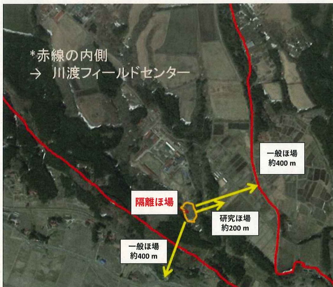
図2, 東北大学大学院農学研究科附属複合生態フィールド教育研究センター周辺隔離ほ場試験区より、最も近い一般農家の水田までの距離は約400 m、また、センター内の最も近い研究用水田までの距離は200 mである。