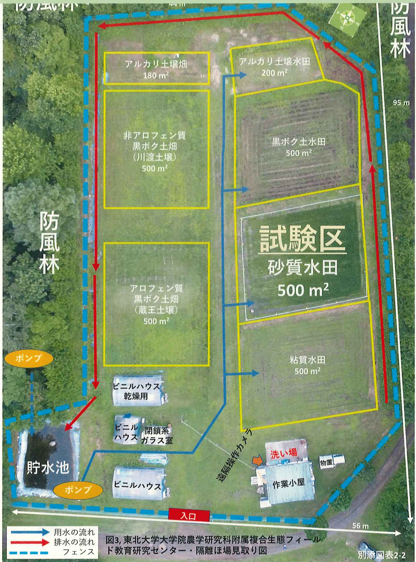
図3, 東北大学大学院農学研究科附属複合生態フィールド教育研究センター・隔離ほ場見取り図