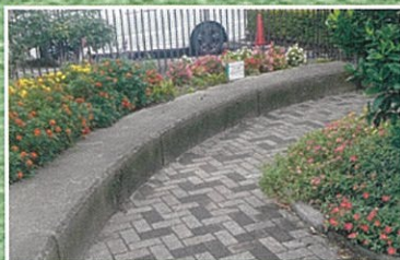
宮城県私立中学高等学校連合会 (聖ウルスラ学院英智高等学校)