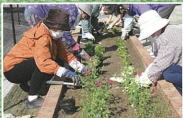
すばらしいおながわを創る協議会 (上一区自治会)