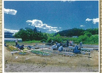
東笠島地域資源保全隊(角田市)