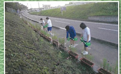
宮城県中学校長会 (塩竈市立玉川中学校)