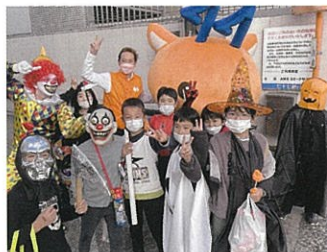
ハロウィンの様子

その後、子どもが駆け込 んできた時に正しく対応 できるようリアルな防犯 訓練が必要だと感じ、荒 町商店街振興組合、荒町 児童館、荒町市民センター が中心となって、管轄の若 林警察署や警備会社に協 力を要請しました。さらに 学区内にある、団体や企 業にも声がけをして実行 委員会を立ち上げました。 それぞれの団体の日頃の 取組を聞くと、地区社協 が独自で子どもの見守り をしていたり、企業が会社 周辺の清掃をしたり、PT A保護者が信号機前で誘 導していたり、それぞれが 出来る範囲で見守り活動 をしていることに気が付 きました。