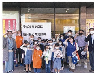
子どもがお店に駆け込む防犯訓練の様子

また、「どの町でも実現 可能なしくみづくり」を念 頭に置き、他地域に取組 を紹介する活動も行って います。昨年度は大分県や 鳥根県からの依頼も含め、 十二件の事例発表を行 いました。