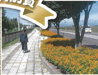
すばらしい松山地域協議会(大崎市)