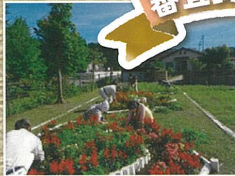
大衡村・衡中東行政区(大衡村)