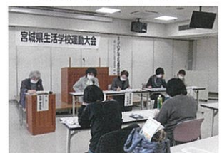
フリートークの様子