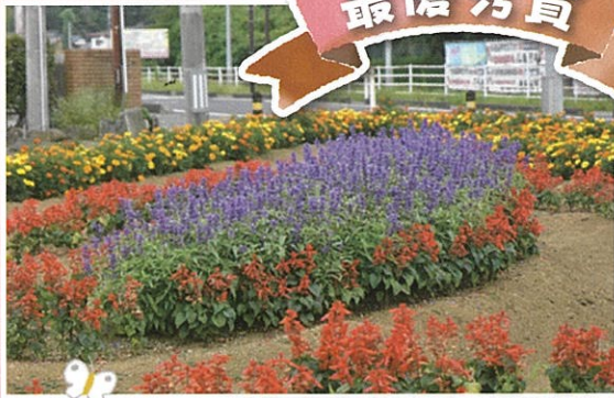
黄金自治会(涌谷町)