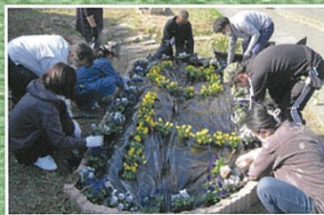
宮城県私立中学高等学校連合会 (東北学院榴ヶ岡高等学校)

美しい生活環境を創る運動を推進する活動を通して、地域に密着し、環境に配慮した取組を推進するため、花壇づくり助成事業を行いました。