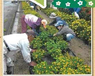
角田市西根13区花の会(角田市)