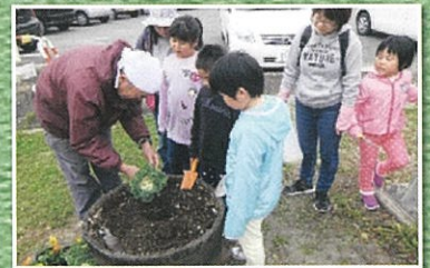
すばらしい涌谷を創る協議会 (黄金自治会)