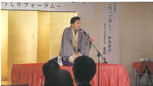
記念講演 落語家立川平林氏