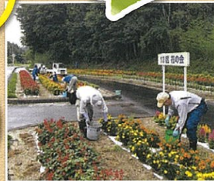
角田市西根4区行政区(角田市)