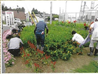
エコロジー八の森環境保全隊(登米市)