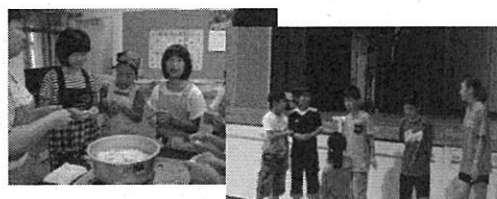
北方小学校 「合宿通学」

4 主 管 登米市推進地区連絡協議会 推進校 登米市立佐沼小学校 登米市立北方小学校 登米市立佐沼中学校 宮城県佐沼高等学校 宮城県立迫支援学校