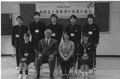
佐沼高等学校「移動市長室」(佐沼中生も参加)