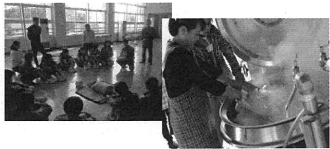
佐沼中学校 「総合防災訓練」