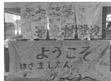
迫支援学校 「学校間交流」