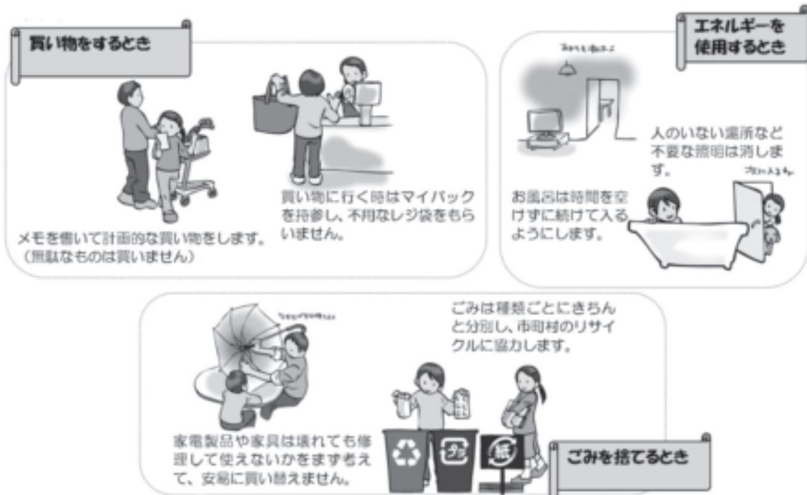
▲個人でできる環境配慮行動の一例（みどりの小道環境日記2012宮城版より抜粋）

(※みやぎe行動 (eco do!) 宣言については、第3部第5章第3節の記述も御参考ください。)