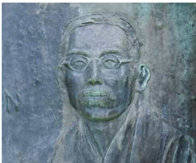
落合直文（気仙沼市煙雲館（直文の生家）所蔵）

直文は、すっかり悪くなってしまったりんごを、やはりおだやかな目で見つめ続けました。