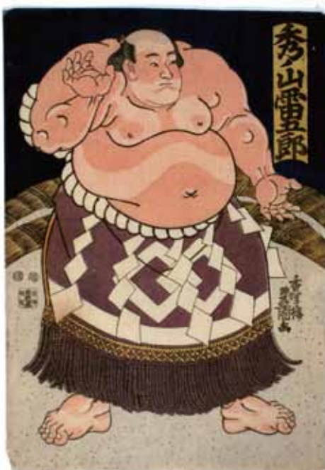
横綱 秀ノ山雷五郎

平成二十三年三月十一日の東日本大震災の大津波で、秀ノ山の生家付近も大きな被害を受けました。けれども、今も生家の近くの岩井崎には、彼の銅像が遠く太平洋に、そして未来に向けて右手を大きく伸ばしてすつくと建っています。