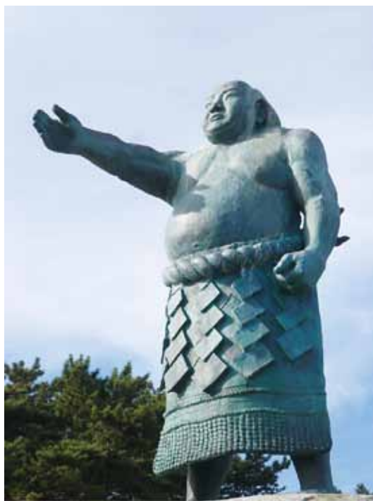
秀ノ山雷五郎の銅像（気仙沼市波路上岩井崎園地内）

辰五郎はその力自慢を生かし、相撲取りになりたいという夢をもっていました。辰五郎には、地元の草相撲で大関として大活躍をしていた自慢の兄がいたからです。辰五郎はそんな兄に強いあこがれをいっていました。